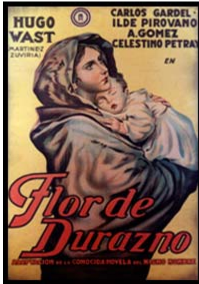
Afiche de promoción del film Flor de durazno