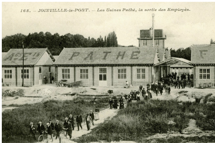
Los estudios cinematográficos de Pathe en Joinville en los inicios del sonoro.

En una entrevista realizada el 24 de septiembre de 1931 por el diario argentino Noticias Gráficas Gardel señalaba: “Tengo compromisos contraídos con la Pathé y la Paramount, haré cinema”. ¿Por qué el artista mezclaba a la gran compañía cinematográfica francesa y a la no menos importante norteamericana al definir sus perspectivas de filmación? En realidad, su percepción recogida en París se correspondía con el cruce histórico de ambas compañías que se produciría vinculado con la producción de películas sonoras que se desarrollaría en dos estudios cinematográficos situados en proximidad, pero en abierta competencia económica y artística.