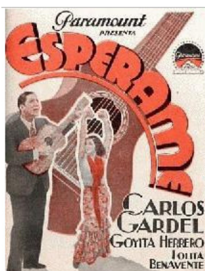
Aviso publicitario de la Paramount para "Espérame"