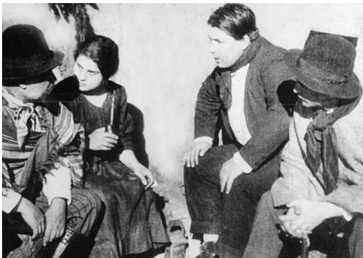
Una de las escenas de la película Flor de Durazno

Flor de Durazno fue adaptada al celuloide respetando la estructura melodramática de la novela original (estructura que, por otra parte, parecía inevitable en la naciente construcción de géneros cinematográficos). Para Defilippis Novoa, de la misma edad que Gardel, el cine también era un desafío. De su tiempo como maestro rural le