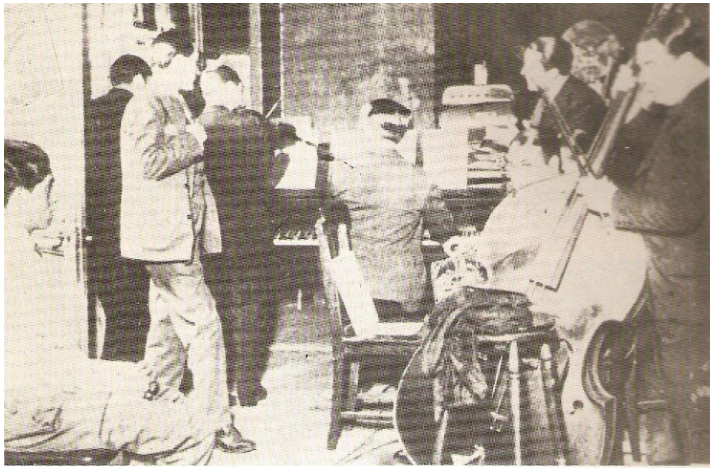
Carlos Gardel ensaya Viejo smoking junto a la orquesta de Canaro.

Merayo indica que mientras el cantor esperaba que pusieran las luces, estaba en camiseta y se iba para el patio, donde unos muchachos le cebaban mate mientras él hablaba sobre su futuro viaje a Europa. Gardel estaba muy entusiasmado con hacer cine y les decía que cuando regresara se iba a dedicar en serio a trabajar en películas de largometraje. Filmaron durante quince días, a razón de una película por día.