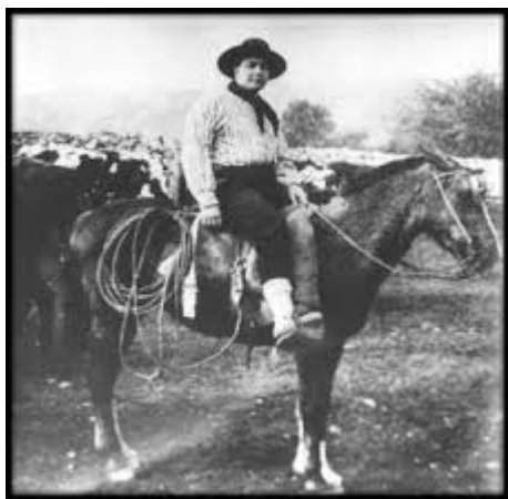
Carlos Gardel a caballo durante el rodaje

En 1917 Carlos Gardel fue convocado a participar en la filmación de Flor de durazno . Como es sabido, en esa época el cine era silente y puede resultar llamativo que un cantor fuera incluido en el reparto de un film de ese tipo. Incluso diversos autores han manifestado su extrañeza en este sentido, como por ejemplo Simon Collier, quien ha señalado: “No se entiende bien por qué se llamó a Gardel. La película iba a ser muda; Gardel no cantaría. En esa época estaba excedido de peso (entre los 108 y los 120 kilogramos según el autor) y no tenía experiencia como actor”.