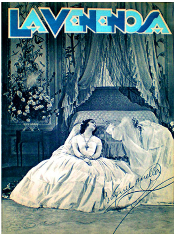
Afiche promocional de La Venenosa, el film que pudo significar el debut cinematográfico de Gardel