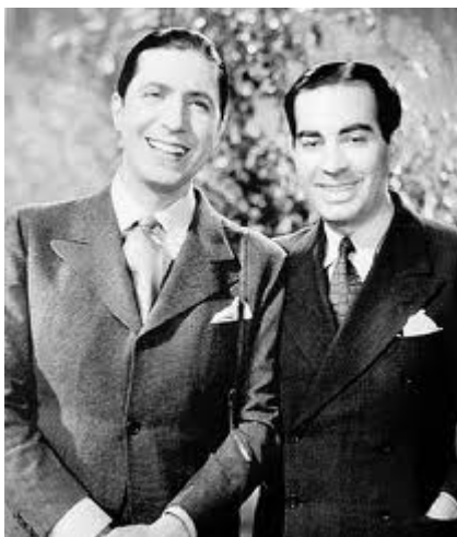
Carlos Gardel y Alfredo Le Pera, una de las sociedades artísticas más talentosas y recordadas del siglo XX