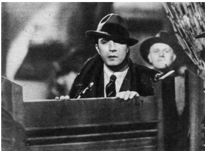
Carlos Gardel caracterizado para el film