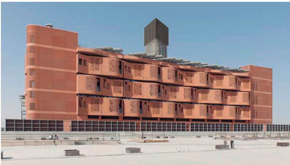
Figura 18. Masdar bajo construcción (Foster & Partners, 2008).

Fui a Masdar City en 2010 con altas expectativas, pero no me fue permitido tomar ninguna fotografía in situ. La pregunta es: ¿por qué este espectacular conglomerado de representantes del Estado, arquitectos mundialmente destacados, ingenieros especializados, ambientalistas de pensamiento empresarial y constructores corporativos de ciudades insisten en semejante control sobre información esencial? Entre otros motivos, los funcionarios oficiales del gobierno que trabajan para la compañía responsable del proyecto de Masdar City o cualquier empleado en el lugar puede ser acusado de perjudicar la economía nacional si participan de un debate público acerca del proyecto o cuestionan sus condiciones generales (2015).