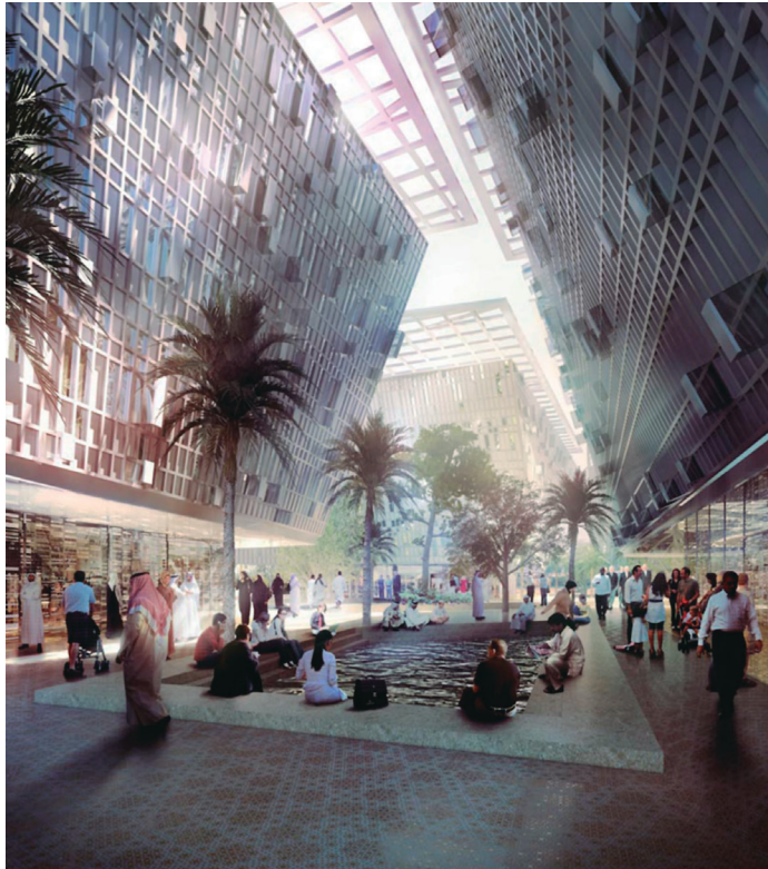
Figura 2. Calle interior (Ib.).