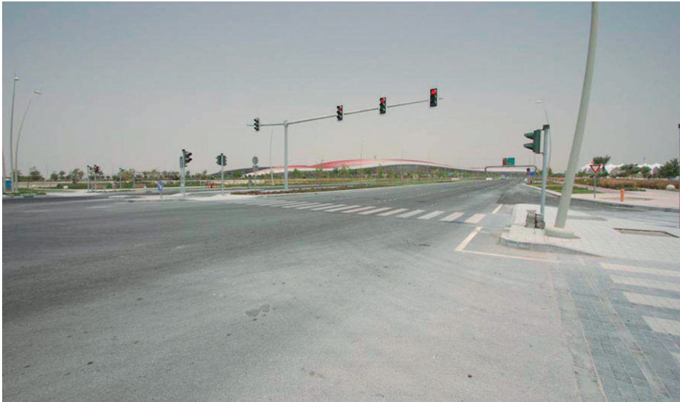
Figura 16. Ingreso a Masdar (Masdar City: A Critical Retrospection, s.f).