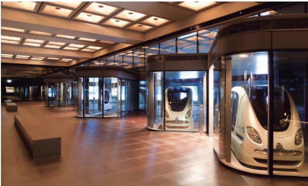
Figura 4. Servicio de taxis subterráneo (Masdar, a Mubadala Company, s.f).

Tal como describe Galindo en su artículo sobre Masdar, con el propósito de fundar una ciudad eficiente, se torna fundamental adaptar el diseño al clima intenso de la región caracterizado por calores extremos y tormentas de arena. En este sentido, se unen al proyecto las costumbres de la arquitectura árabe tradicional y su evolución tras la aplicación de las últimas tecnologías vigentes. Con el objetivo de reducir veinte grados el clima medio, se emplean los siguientes recursos: un muro perimetral a la ciudad con el fin de servir de tamiz a las polvaredas, continuo de un anillo de vegetación. Para beneficiarse de las corrientes nocturnas y reducir así el impacto de la radiación solar; los pasajes son semicubiertos, angostos y oblicuos a la traza urbana (véase Figuras 1 y 2) a los que se suman la vegetación, los techos verdes y el equipamiento con agua para el descenso pasivo de la temperatura. En las construcciones privadas y en los espacios públicos son diseñados conductos árabes clásicos para retirar el aire caliente del día y ganar las brisas frescas de la noche. Además, las cubiertas, dispuestas en avenidas y zonas públicas son generadoras de energías limpias (véase Figura 3) (Ib., 2015).