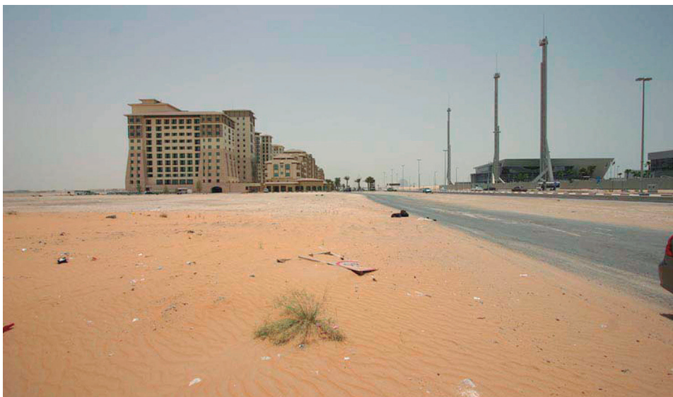
Figura 17. Estado actual Masdar (Ib.).