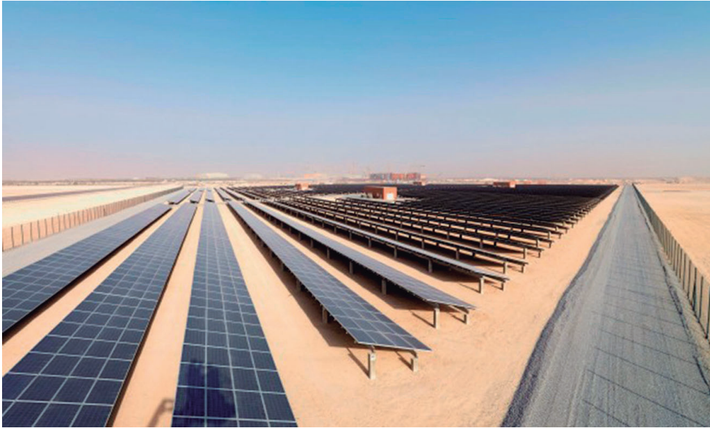
Figura 5. Planta de paneles solares (About Masdar clean energy, s.f).

mercaderías, con el fin de aliviar las calles principales y ceder éstas para el uso peatonal únicamente, éste es accionado por medio de energía solar y contempla una flota de vehículos subterráneos sistematizados (Lancellotti, 2010).