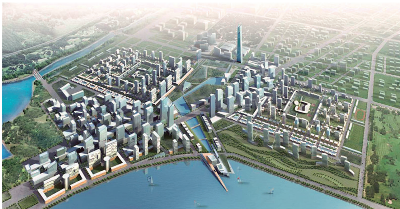
Figura 10. New Songdo City (Datuopinion, s.f).