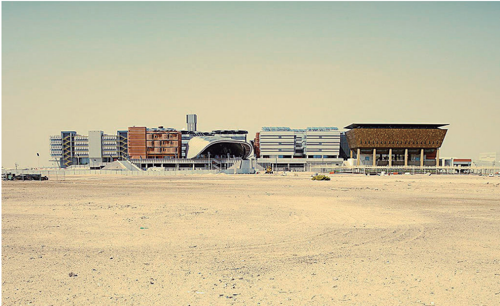
Figura 19. Masdar actualmente (Antony, T., s.f).

Una búsqueda rápida en Google con el título 'Masdar City', en 2010 dio lugar a más de cinco millones de resultados, lo que de alguna manera confirmaba la prominencia del proyecto. Hoy el número ha bajado a cerca de medio millón de resultados (Ib.). El análisis de esta información en su conjunto da cuenta de la falta de información actualizada sobre la situación actual del proyecto, la caída de interés general acerca del mismo y la cantidad de interrogantes que se abren acerca de la primera ciudad 100% sustentable del mundo.