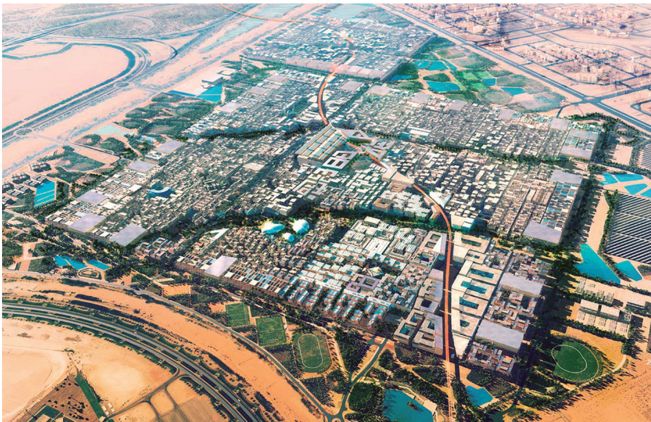
Figura 1. Master Plan Masdar (Foster & Partners, 2008).