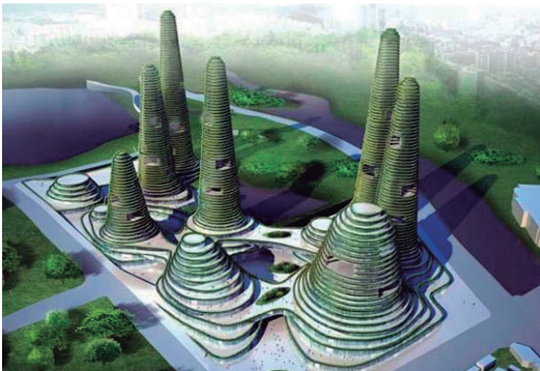
Figura 9. Gwanggyo Power Centre (Tuexperto, 2009).