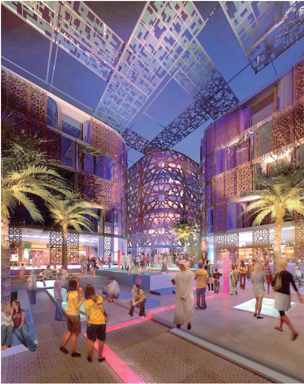
Figura 14. Calle interna (Foster & Partners, 2008).