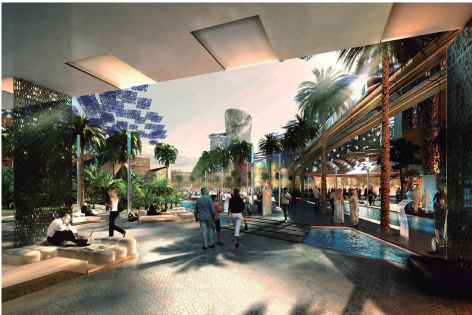
Figura 3. Espacio público semicubierto (Ib.).