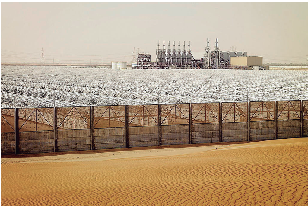
Figura 6. Shams 1. Planta de energía solar. (Antony, T., s.f).