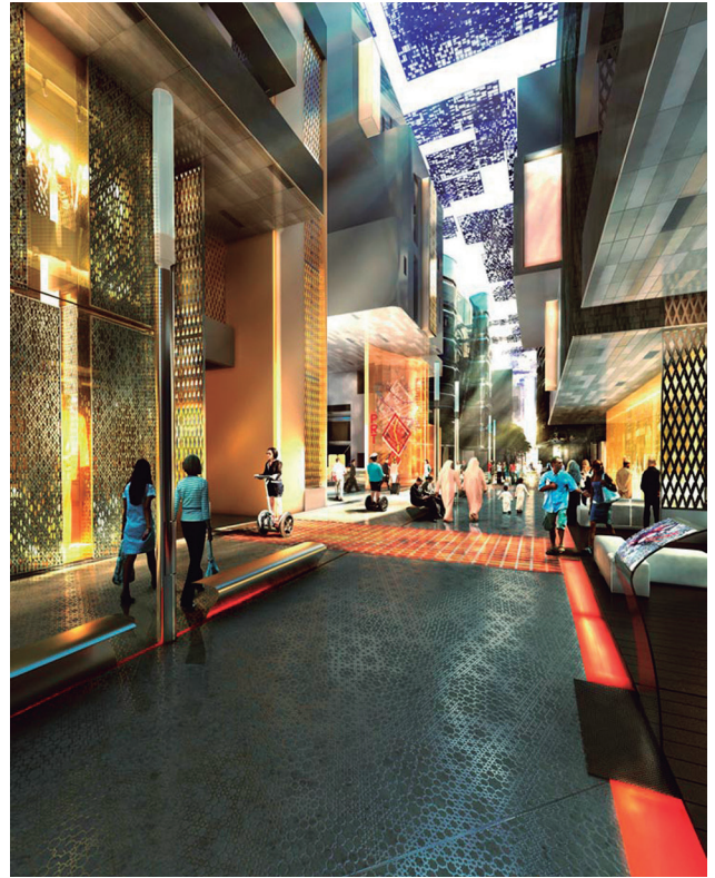
Figura 15. Calle interna (Ib.).

La ambición del proyecto resulta realmente loable, aunque se debe destacar que las ilustraciones que se presentan parecieran muy similares a las de un shopping de diseño árabe tradicional (véase Figuras 14 y 15). Por ello cabe preguntarse si la nueva urbanización parece un centro comercial, acaso podría tratarse de un bien particular que se beneficia del concepto sustentabilidad como una captación adicional del cliente o futuro residente urbano, alejándose éste del entendimiento más amplio del concepto ciudad (Ib., 2012).