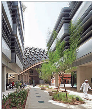
Figura 8. Laboratorios (Masdar, a Mubadala Company, s.f).

Masdar es el Instituto de Ciencia y Tecnología (MIST), una colaboración sin ánimos de lucro para la investigación y el desarrollo entre el Instituto de Tecnología de Massachusetts (MIT) y Masdar (Jensen, 2015). Además de proponerse ser el centro académico por excelencia de las energías renovables y tecnologías limpias (véase Figuras 7 y 8), también busca ser el núcleo de absorción de startups y empresas mundialmente reconocidas en este mismo enfoque.