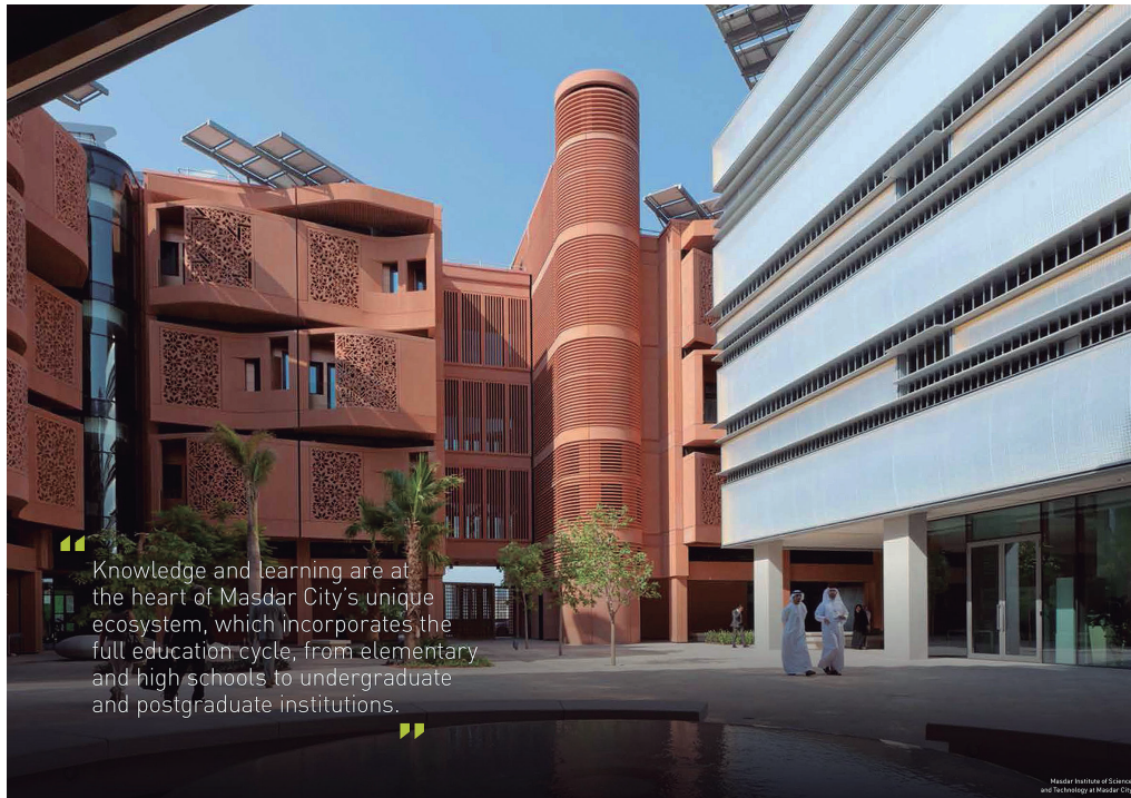
Figura 7. Centro de estudios académicos. (Masdar city, s.f).

La producción energética de Masdar se ha determinado en función de cálculos basados en la demanda racional de los recursos disponibles. La ciudad entera es alimentada por 87.777 paneles fotovoltaicos que se encuentran en un campo de 22 hectáreas de extensión (véase Figuras 5 y 6), a los que se les adicionan otros paneles solares que se encuentran en las terrazas de los edificios. El diseño de los muros de las edificaciones (amortiguados por cámaras de aire que limitan la radiación solar) ayuda a reducir la necesidad de acondicionamiento mecánico en un 55%. No existen las llaves de luz ni los grifos, sólo sensores de movimiento; que según las autoridades de Masdar de este modo han recortado el consumo de electricidad en un 51%, y el uso de agua en un 55% (Kingsley, 2013). El proyecto ensaya también el tratamiento de aguas residuales y la recuperación de agua procedente de la evaporación, la cual pretende minimizar, a su vez, el empleo de la planta desalinizadora con que se ha dotado a la ciudad. La recuperación de residuos ha sido prevista para producir cero emisiones de CO 2 . Se calcula que el 50% de estos materiales podrán ser directamente reciclados y un 17% dedicado al compostaje. El resto, no reciclable, se utilizará como combustible en una planta incineradora subterránea. La cantidad estimada de residuos ronda las 350 toneladas diarias (Goitia, 2013).