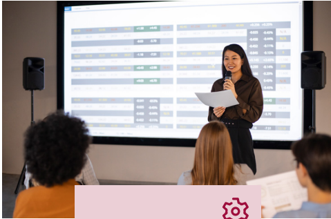
TALLER DE TRABAJO FINAL

Instancia de carácter integrador y autogestiva que promueve la indagación, profundización y transferencia de saberes en temáticas/intervenciones de libre interés del alumno.