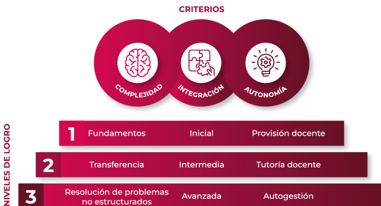
Escalamiento de la competencia

La gradualidad y progresión en el desarrollo de la competencia plantea su necesario escalonamiento a través de niveles de complejidad, integración y autonomía creciente en el desempeño del estudiante.