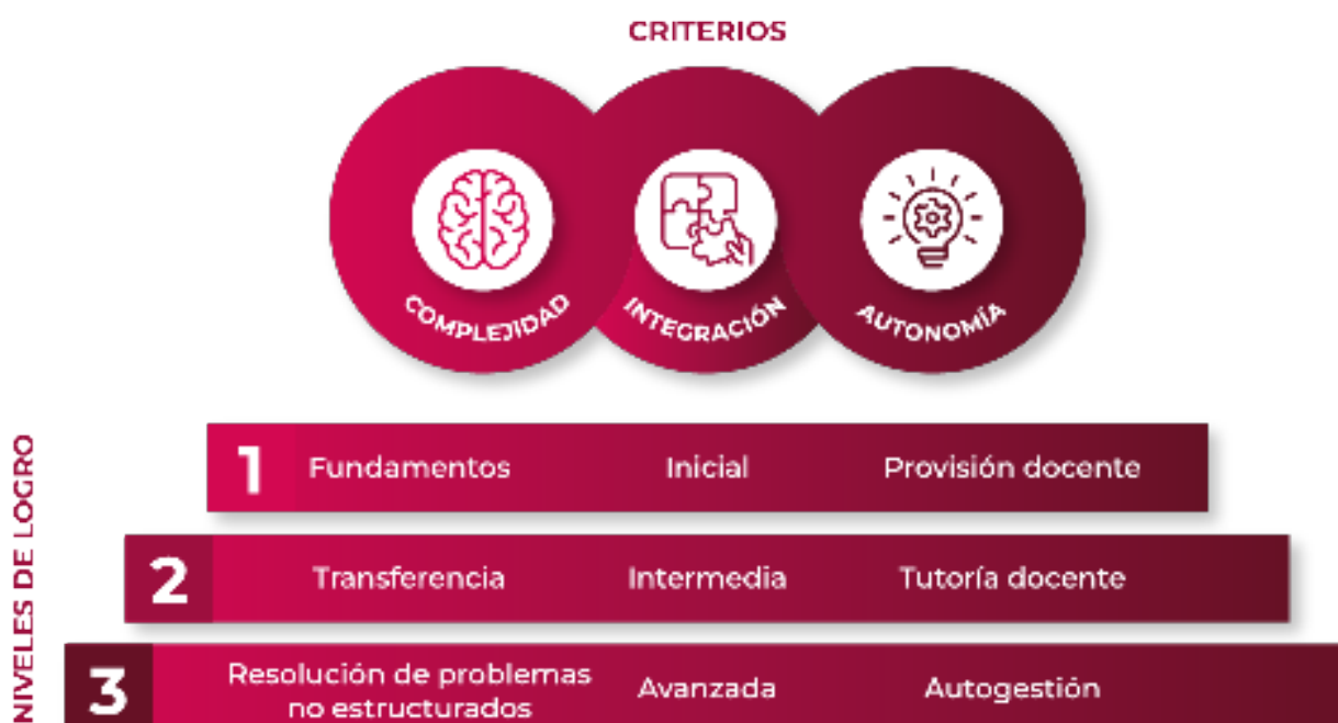
Escalamiento de la competencia

La gradualidad y progresión en el desarrollo de la competencia plantea su necesario escalonamiento a través de niveles de complejidad, integración y autonomía creciente en el desempeño del estudiante.